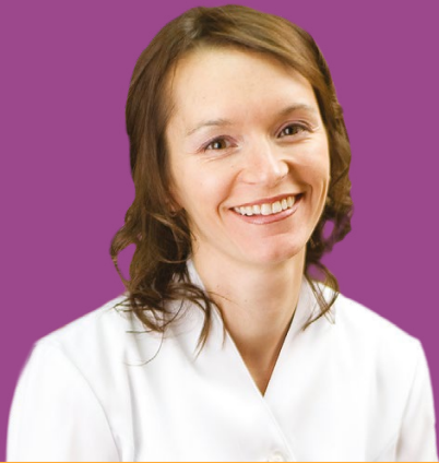
Tableau comparatif Quelle option dentaire choisir ?